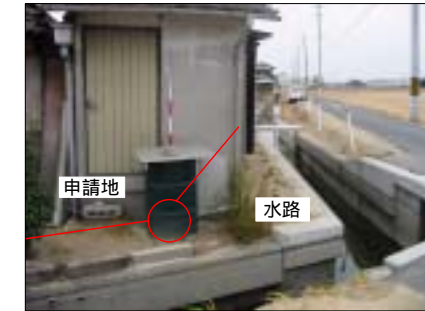
K4 ポール付近 (建物角から約94cm、中へ約3cm)